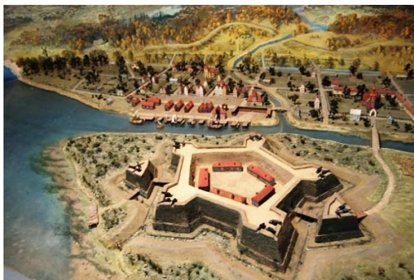
Крепость Ниеншанц и город Ниен. 1614 г. Реконструкция.

Во время польско-шведской интервенции западная от Волхова часть земель отошла к шведам по Столбовскому договору 1617 года, подписанному первым царём из династии Романовых – Михаилом Фёдоровичем. Западные земли – Ингерманландия – стали местом, где поселились шведские военачальники, исповедовавшие лютеранство и насаждающие его местным жителям. Потому на этих землях, в том числе и по берегам Невы (в устье реки Охты, в шведском городе Ниен) появлялись лютеранские кирхи.