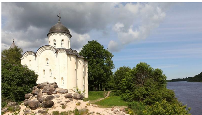
Георгиевский храм. Старая Ладога. 1164 г.

В то далёкое время, когда ещё на северо-западе российских земель и Петербурга то не было, а на землях Водской пятины Новгородских земель расселялись финно-угорские (вепсы, водь, карелы, ижоряне, чудь) и славянские (ильменские словене, кривичи) племена, здесь возводились капища (места поклонения языческим богам). С конца 10 века язычество постепенно стало вытесняться новой верой – православной, принятой для Руси киевским князем Владимиром Святым (Красно Солнышко) в 988 году. Именно с этого времени на новгородских землях стали возводиться православные храмы. А языческие идолы были сброшены в Волхов. Первые из таких храмов были сооружены в первой столице Древней Руси – Старой Ладогге.